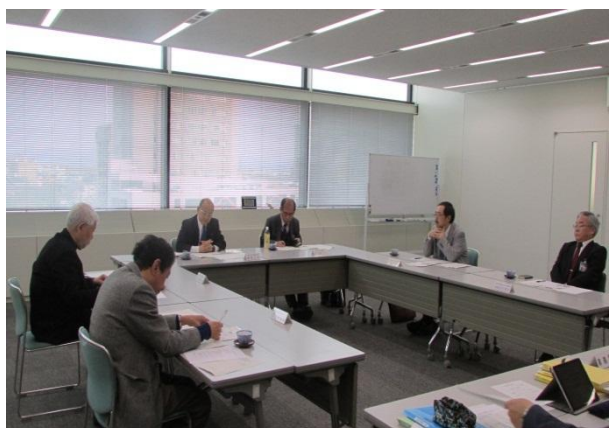
第3回運営委員会の様子